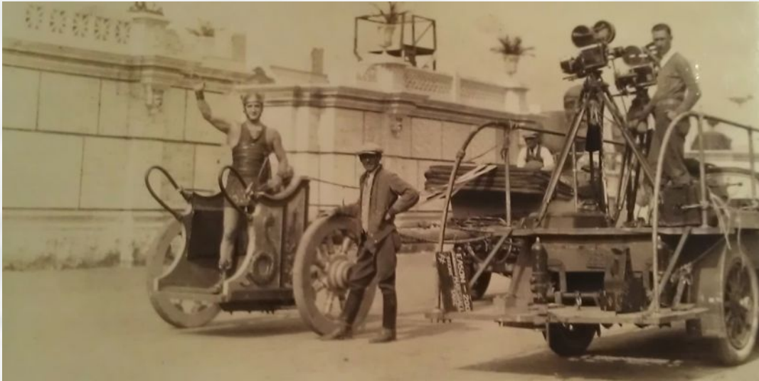
Dreharbeiten von Ben Hur: A Tale of the Christ (1925)