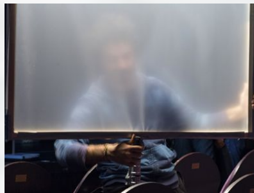
Adriano Grilli Redaktion Light & Grip

dass Wörter wie DGUV, BetrSichV und TRBS, VDE, ArbSchG usw kein Hirngespinnst sind und dass – ob man sich dessen bewusst ist oder nicht – diese Elemente unser Arbeitsumfeld prägen und regeln.